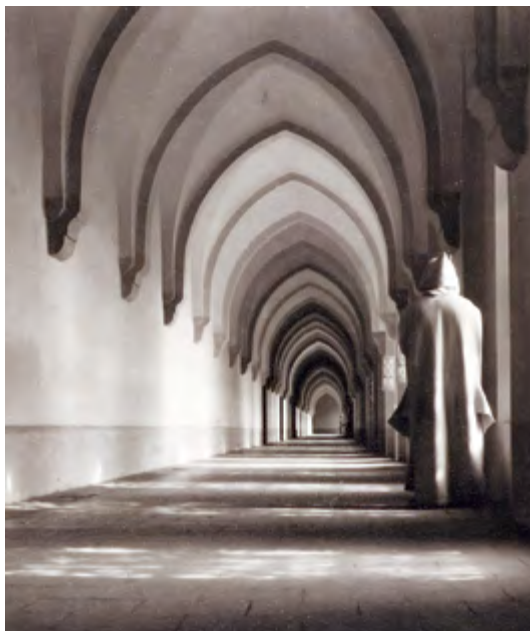
Der Kreuzgang der Kartause Maria Hain und ein Mönch.

Mitten im 25.000 Quadratmeter großen Klostergarten befindet sich der Friedhof. Beim Umzug 1964 ins Allgäu betteten die Mönche auch die Verstorbenen um.