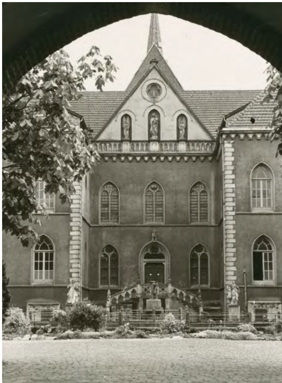
Die Fassade von Schloss Hain, vom Klosterhof aus gesehen. An die Rückfront des ehemaligen Rittergutes angelehnt wurde die Kirche gebaut. Ein Teil des Turms ist im Hintergrund zu sehen.