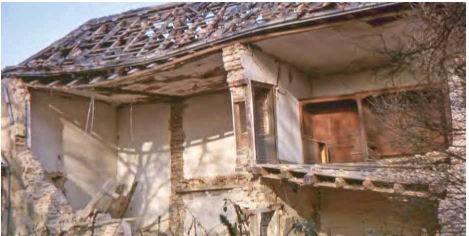
Zweigeschossiges Zellenhaus mit aufgerissener Frot. Der Wohnraum oben rechts wurde für die Ausstellung nachgebaut.

Insgesamt 6 Wochen war der damals 25-jährige Schauf ganz allein mit dem Abbruch der Klosteranlage beschäf-