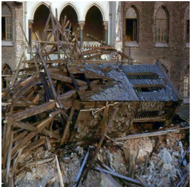
Der Kirchturm auf dem Schutthaufen, dahinter die Wand zum früheren Rittergut Hain, das von Schaufs Schwester gesprengt wurde.