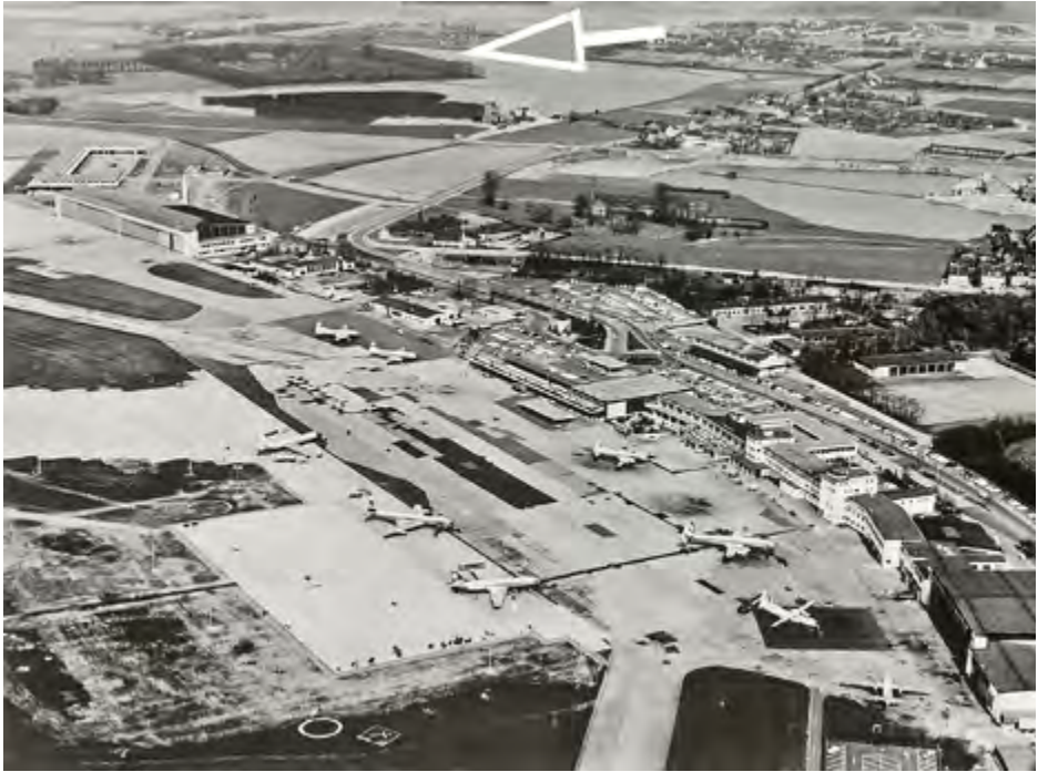
Das Luftbild von 1963 zeigt den nur noch geringen Abstand der Flughafengebäude zur Kartause Maria Hain (Pfeil). Die dunkle Fläche darunter ist der durch den Kiesabbau entstandene Baggersee.