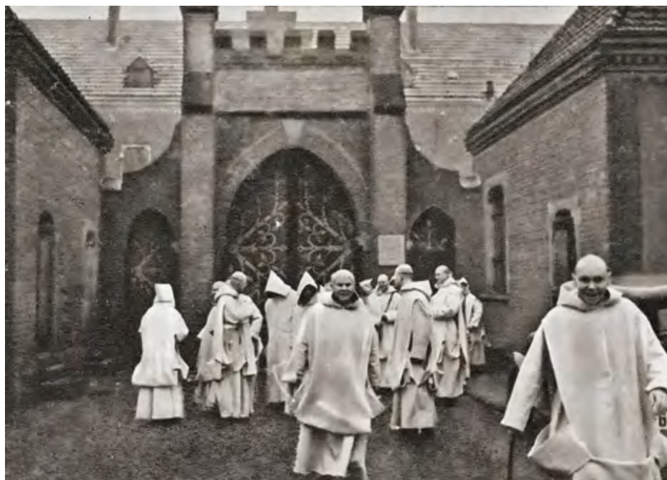
Der Haupteingang der Kartause Maria-Hain mit Mönchen, die zum Spaziergang aufbrechen. Wer rechts an der Pforte anklopfte, erhielt Geschenke, Mahlzeiten und während des Krieges auch Schutz vor Verfolgern.

Hier einige Stimmen von Zeitzeugen aus einem Aufruf in sozialen Netzwerken und persönlichen Gesprächen: