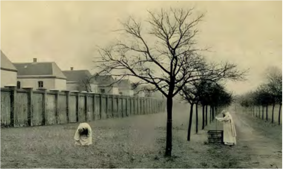
Mönche bei Arbeiten an Obstbäumen im Grüngürtel um die Kartause. Im Hintergrund Wohnhaus-Zellen der Patres und der Kirchturm

Irmgard K.: Ich kann mich noch gut an das leckere Schwarzbrot und die Spekulatius erinnern.