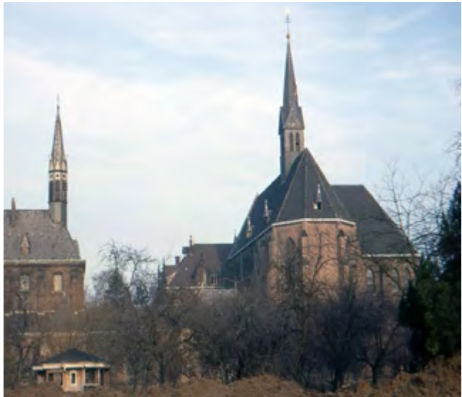
Eines er letzten Fotos von Kirche (rechts), Refektorium und Bienenhaus im Klostergarten.

Vor jeder großen Explosion musste Schauf die Genehmigung der Flugsicherung wegen der zu erwartenden Staubwolke einholen. Dort rief er laut NRZ-Bericht um 15.26 Uhr an: „Kann es losgehen, wir sind so weit?“ Doch in Lohau-