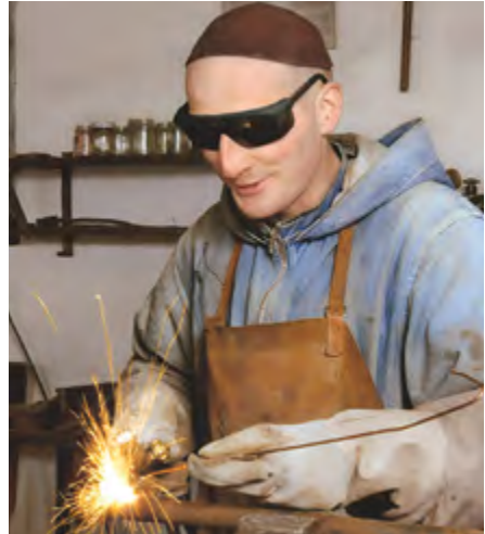
Patres beim liturgischen Gebet in der Kirche und ein Laienbruder bei der Arbeit.